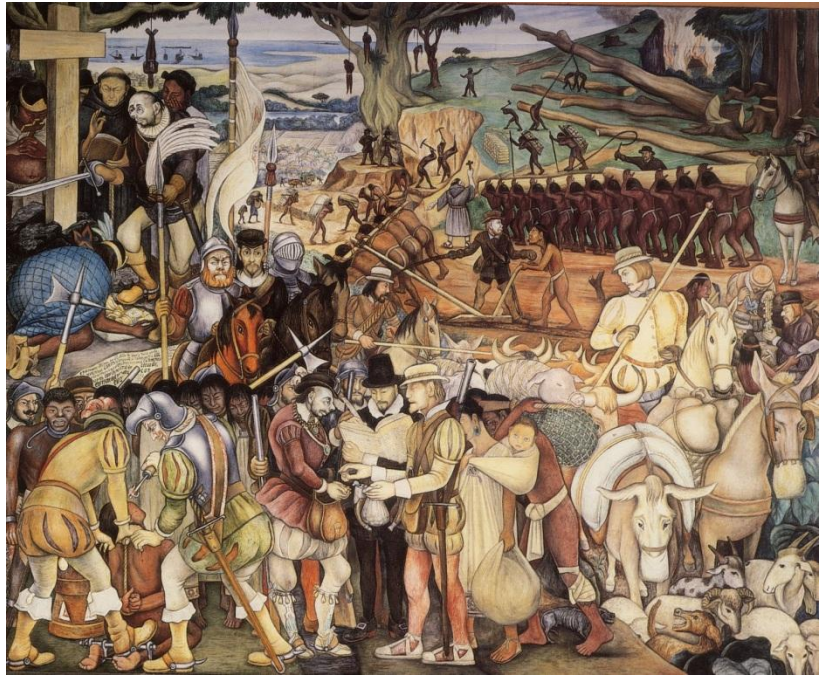
Diego Riviera, La colonización , 1951.

El documento es un fresco pintado por el muralista mexicano Diego Rivera. Representa la colonización de México y sus consecuencias. Hernán Cortés y sus hombres llegaron a México en 1519 y crearon la ciudad de Veracruz (=Verdadera Cruz). Al ver a los españoles, los indios se prosternaron ante ellos porque se imaginaban que eran dioses por sus enormes barcos, su barba, su estatura y las armas de fuego. El calendario azteca también había previsto la vuelta de los dioses.